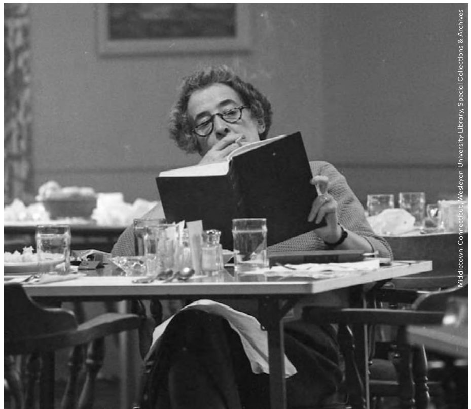
Vom tätigen Lesen: Hannah Arendt in der Wesleyan University 1961/62, Connecticut

Obwohl Arendt schon während des Krieges zu einer scharfen Kritikerin des Zionismus wurde, arbeitete sie kurz vor ihrer Emigration in Berlin für die Zionistische Vereinigung für Deutschland und sammelte für sie antisemitische Propaganda. Dabei hat die Gestapo sie verhaftet. Dass sie nach acht Tagen aus der Haft entlassen wurde, war unwahrscheinliches Glück. Kaum in Paris angekommen, betätigte sie sich für die zionistische Jugendbewegung. Beim Einfall der Deutschen in Frankreich wurde sie im Lager Gurs interniert und nutzte das anfängliche Chaos zur Flucht. 1940 gelang mit ihrem zweiten Mann Heinrich Blücher die Emigration über Marseille und Lissabon nach New York. Dort schrieb sie für Zeitschriften, forderte in der deutsch-jüdischen Emigrantenzeitschrift »Aufbau« die Gründung einer jüdischen Armee, die mit den Alliierten gegen Hitler kämpfen sollte, arbeitete als Lektorin, engagierte sich ab 1949 bei der Rettung jüdischen Kulturguts als Geschäftsführerin der