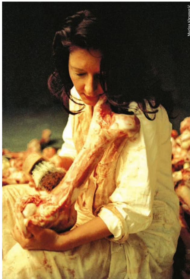
Knochenarbeit: Abramovićs »Balkan Baroque«, 1997

Zeit untätig herumgestanden hatte, während Ulay kämpfte und litt. Solcherart inszenierten die beiden Beziehung, Macht und Hierarchie im Mann-Frau-Verhältnis. »Die einem »unschuldig Leidenden« immanente Aggression übernimmt ein Dritter und gibt ihr – genial sichtbar gemacht – Ausdruck«,